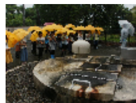
【クリスタルプラザ・水源地(4年生)】